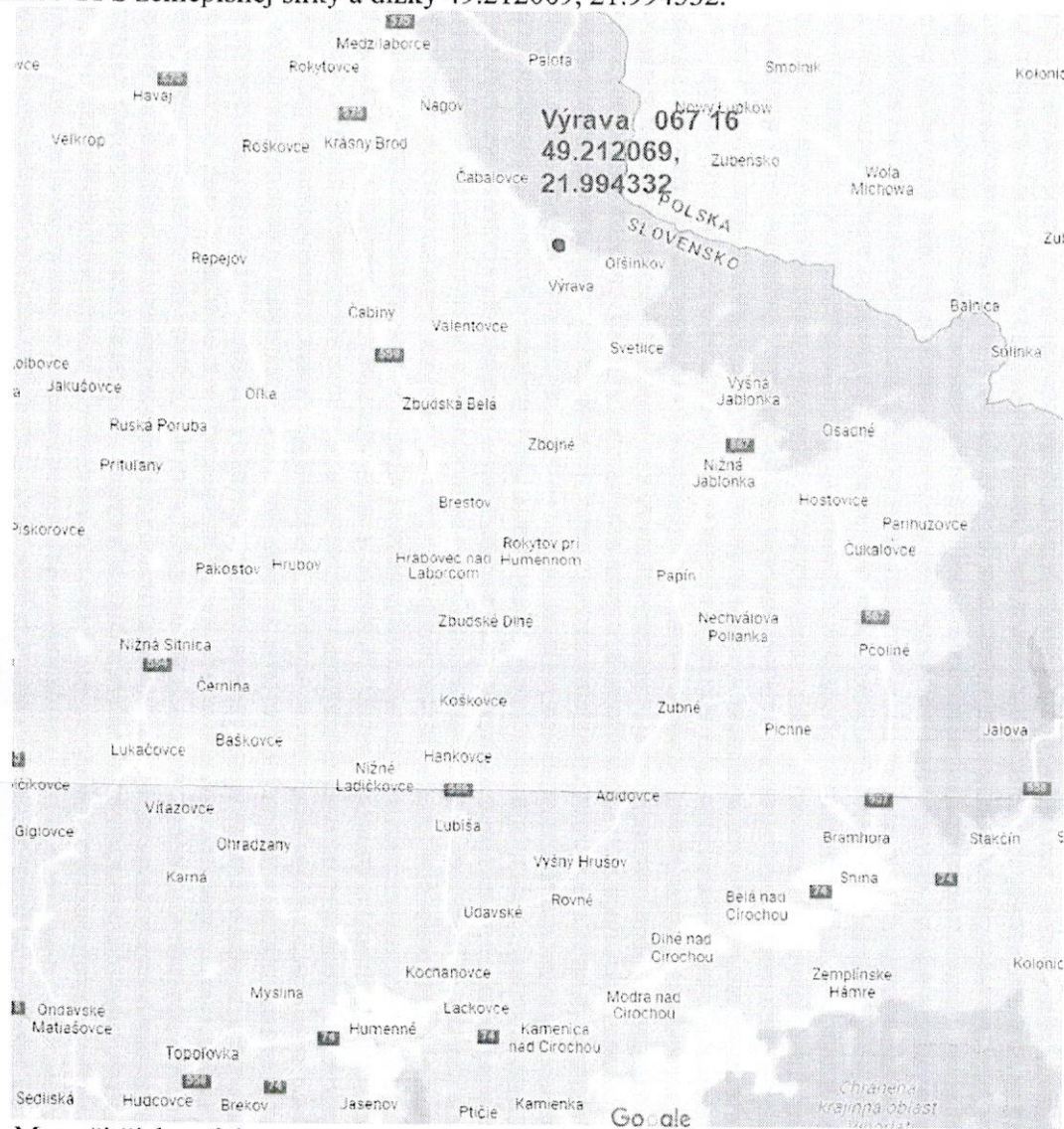
Mapa širších vzťahov.

Mapa s určením polohy miesta stretnutia v deň ústneho pojednávania, v areáli HPS Výrava, súradnice GPS zemepisnej šírky a dĺžky 49.212069, 21.994332.