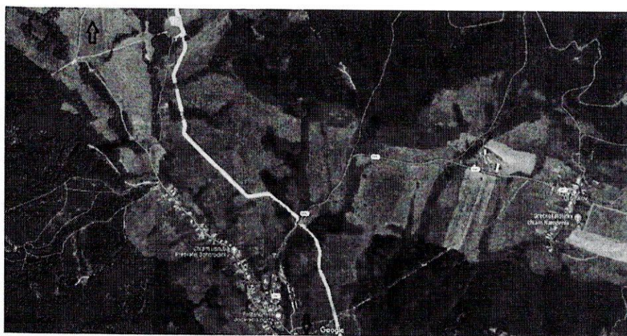
Mapa s určením súradníc GPS zemepisnej šírky a dĺžky 49.212069, 21.994332.